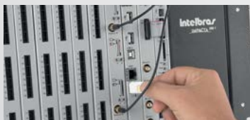
Tarjeta Troncal GSM